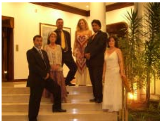
Camerata Fritz Kreisler, Quito

Durante este año hemos preparado los programas “De la Opera al Tango” y “Conversando la Música”.