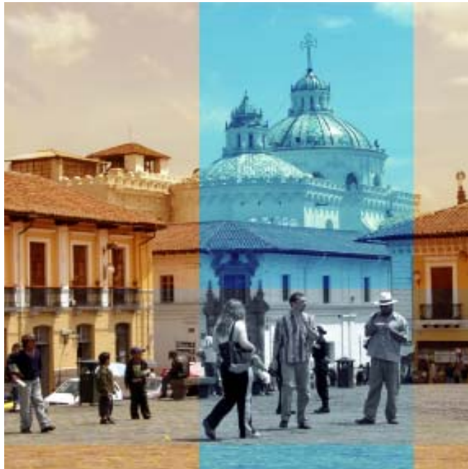
Camerata Fritz Kreisler, Quito