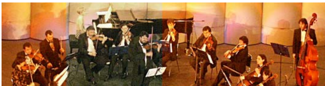
Orquesta Fritz Kreisler

Tras debutar en la Temporada Oficial del Teatro Municipal de Viña del Mar del año pasado, este grupo realizó una exitosa gira por las ciudades argentinas de Mendoza y San Rafael durante Semana Santa, en calidad de únicos invitados extranjeros, donde recibió amplia acogida y favorables comentarios.