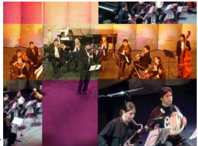
Orquesta Fritz Kreisler